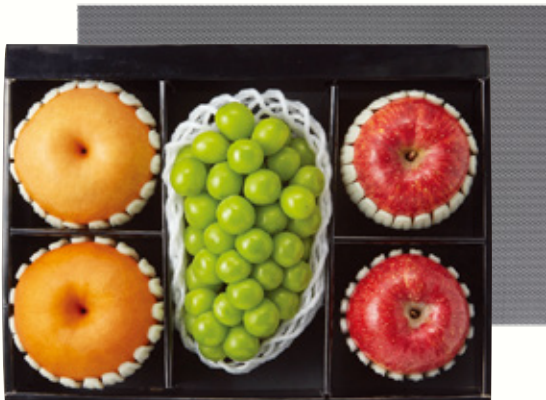
프리미엄 혼합세트 3호