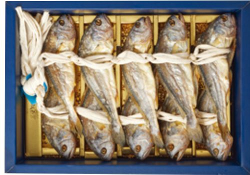
보리 부세 굴비 세트