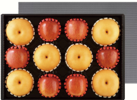
프리미엄 혼합세트 4호