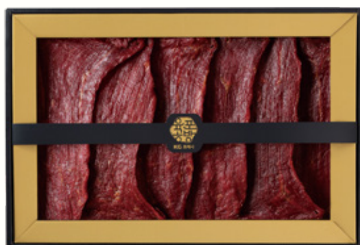
소고기 육포 세트