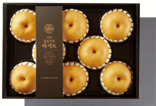
배 선물세트 1호