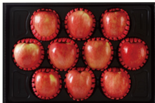
사과 선물세트 2호