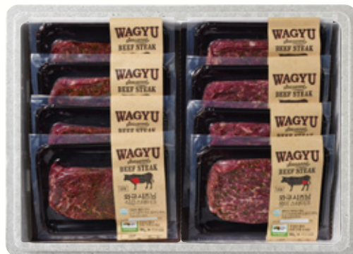
와규 시즈닝 스테이크 세트