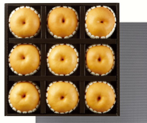
배 선물세트 2호