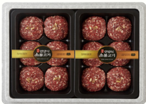
언양식 소불고기 세트