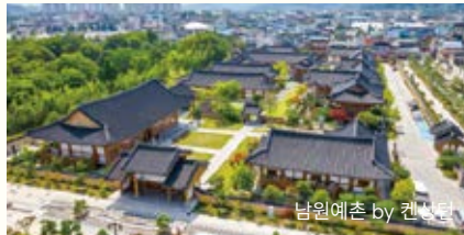
남원예촌 by 켄싱턴