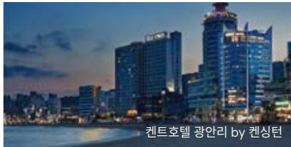
켄싱턴호텔 광안리 by 켄싱턴