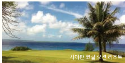
사이판 코럴 오션 리조트