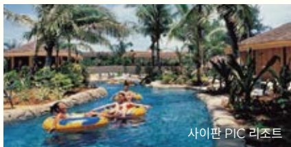
사이판 PIC 리조트