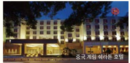
중국 계림 세라톤 호텔