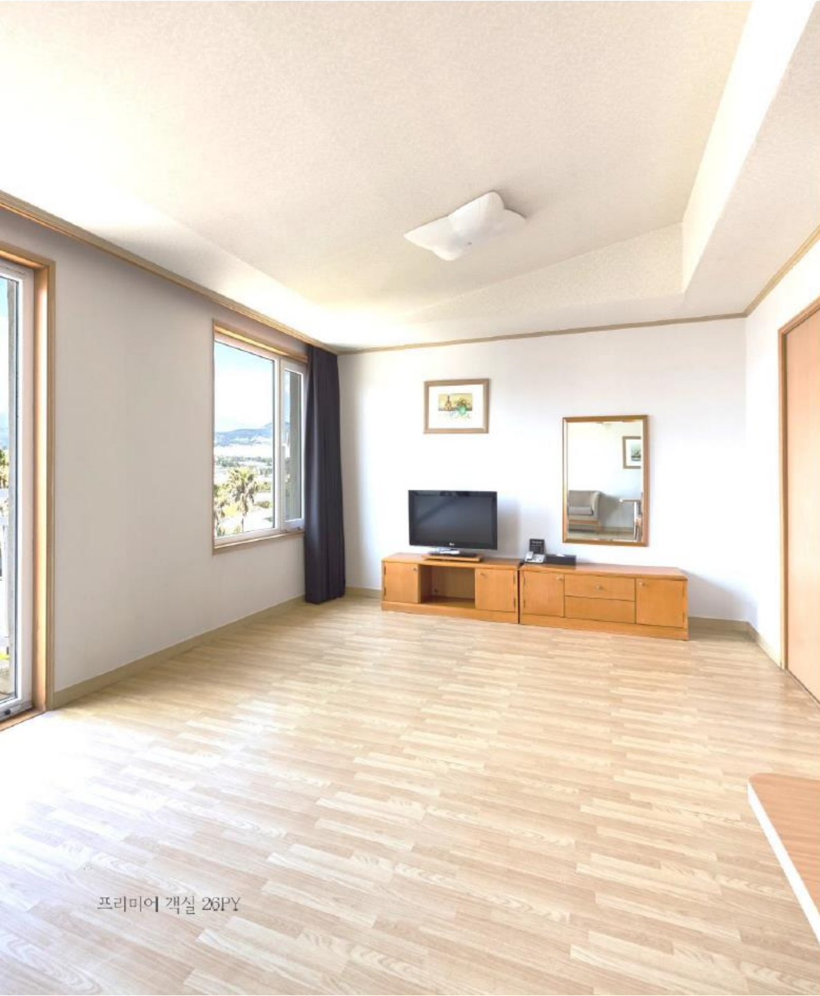
프리미어 객실 26PY