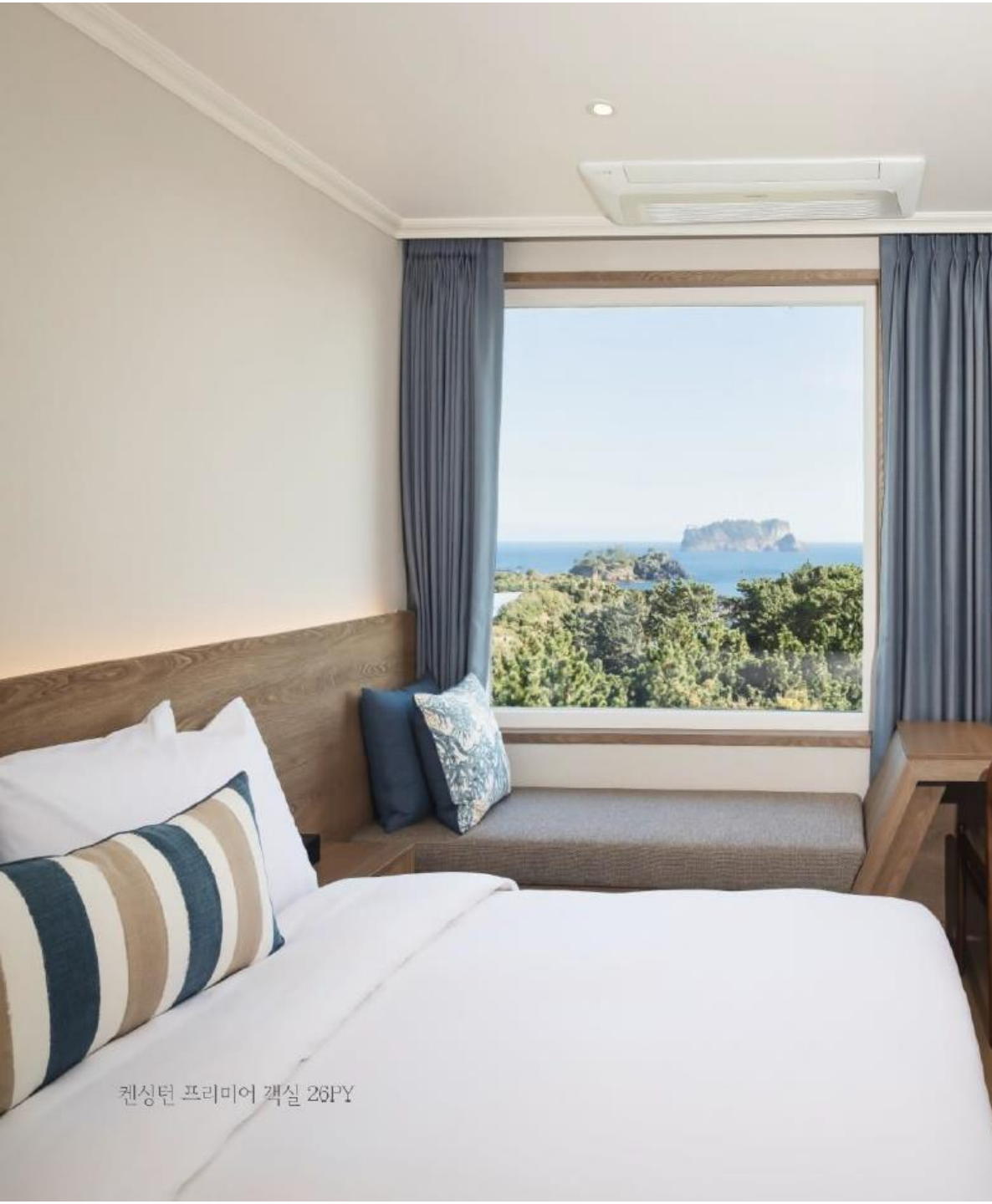
켄싱턴 프리미어 객실 26PY