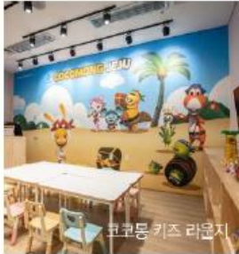
코코몽 키즈 라운지