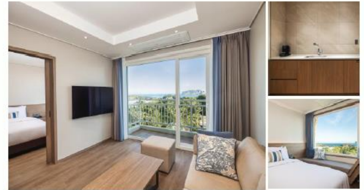
객실 도면 Room Floor Plan

윈도우 벤치에 앉아 제주 풍경을 감상할 수 있는 켄싱턴 프리미어 객실은 2개의 침실과 거실, 다이닝 공간이 분리되어 아늑한 분위기에서 휴식을 즐길 수 있도록 배려된 객실입니다.