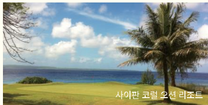
사이판 코럴 오션 리조트