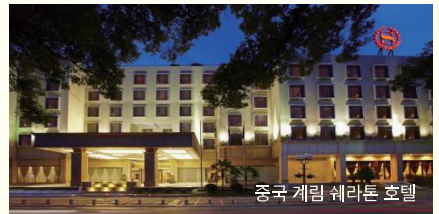
중국 계림 켄싱턴 호텔