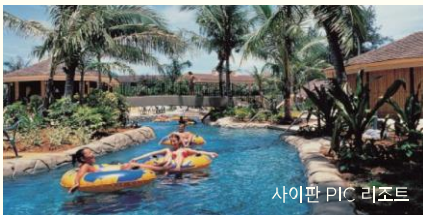
사이판 PIC 리조트