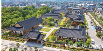
남원예촌 by 켄싱턴