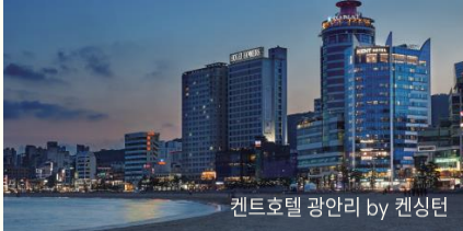
켄트호텔 광안리 by 켄싱턴