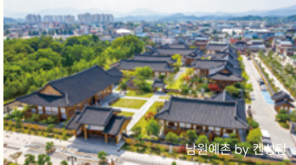
남원예촌 by 켄싱턴