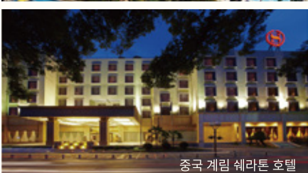
중국 계림 웨라톤 호텔