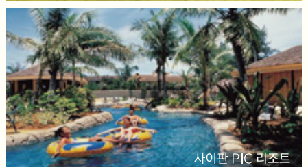
사이판 PIC 리조트