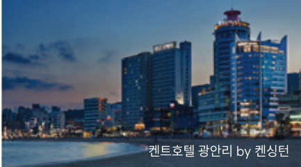
켄트호텔 광안리 by 켄싱턴