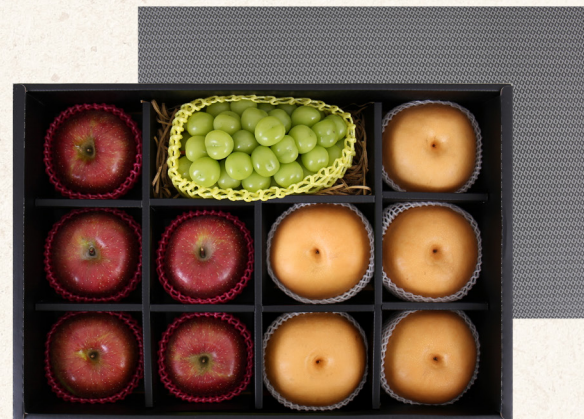
프리미엄 혼합세트 1호