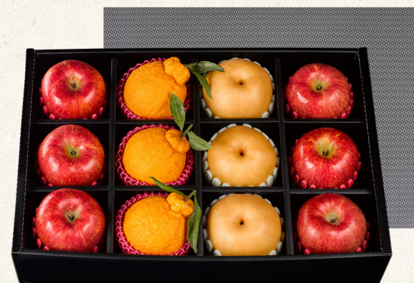
프리미엄 혼합세트 3호