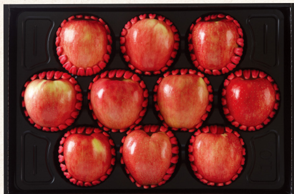
사과 선물세트 2호