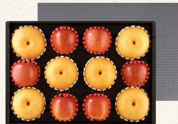
프리미엄 혼합세트 4호