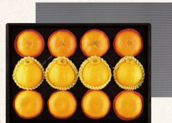
프리미엄 혼합세트 2호