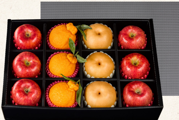
프리미엄 혼합세트 3호