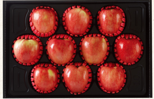
사과 선물세트 2호