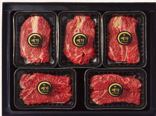
한우 프리미엄 선물세트

좋은 것으로만 엄선한 켄싱턴 한우 선물세트 최상급 마블링과 풍부한 육즙, 맛과 향을 느껴보세요.