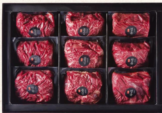
한우 혼합 선물세트