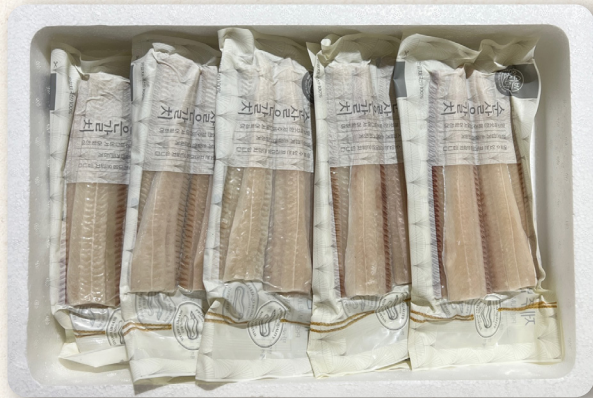
순살 은갈치 선물세트