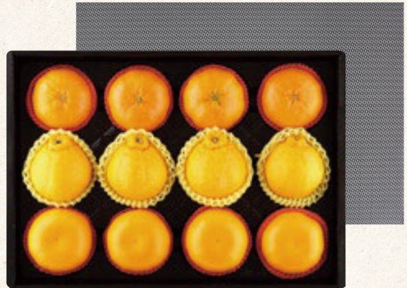
프리미엄 혼합세트 2호