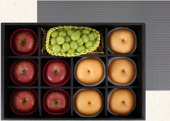
프리미엄 혼합세트 1호