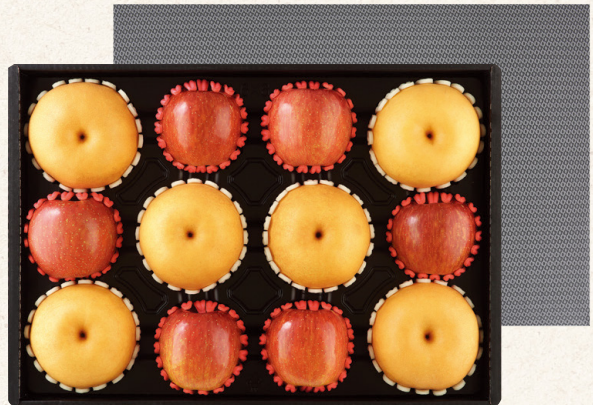
프리미엄 혼합세트 4호